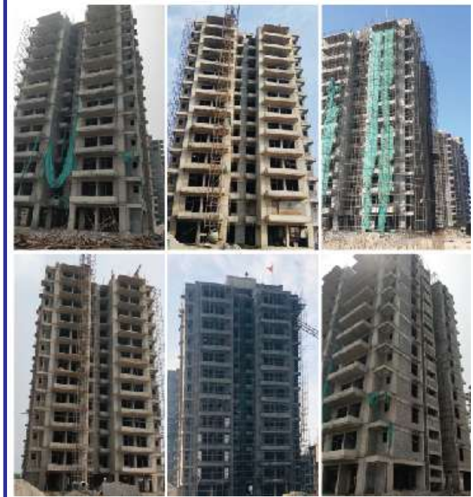
सोनीपत प्लॉट्स की साइट फोटो