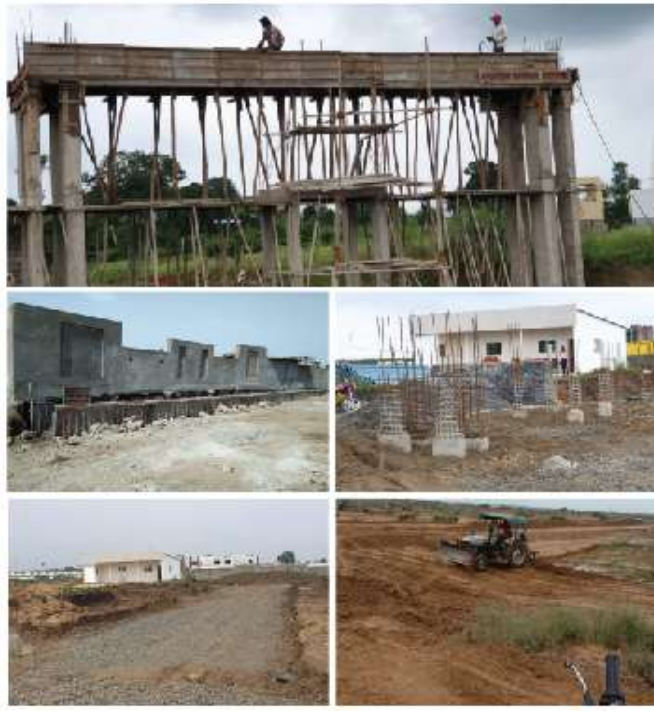
भोपाल प्लॉट्स की साइट फोटो