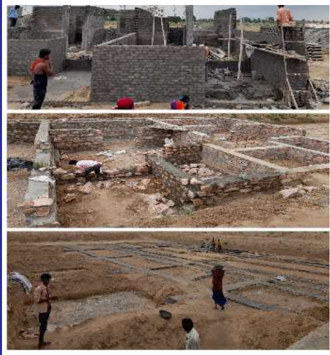
Site Pictures of Jodhpur Villa