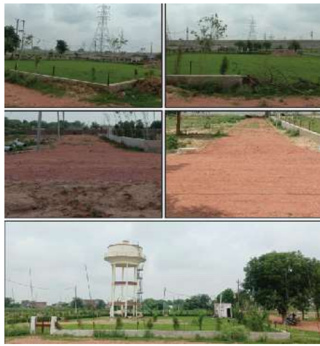
Site Pictures of Agra Plots