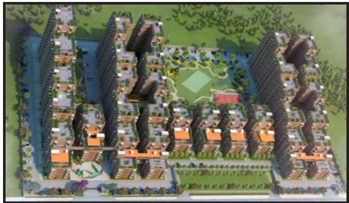
Architectural view of the signature project for SAY India