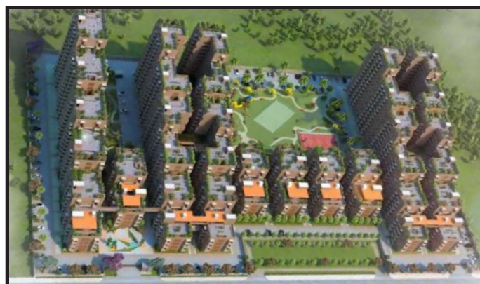
Architectural view of the signature project for SAY India

IPAN में हम इसे "शौर्य एन्क्लेव" कहते हैं!!