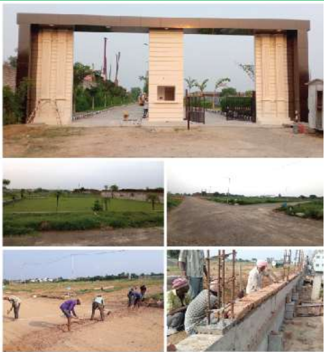
जीरकपुर प्लॉट्स की साइट फोटो