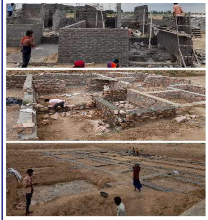
जोधपुर विला की साइट फोटो