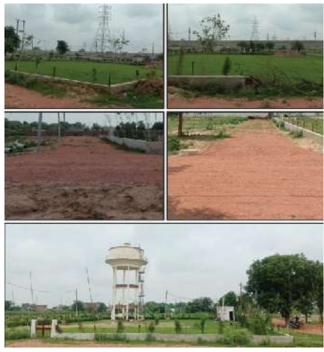
आगरा प्लॉट्स की साइट फोटो