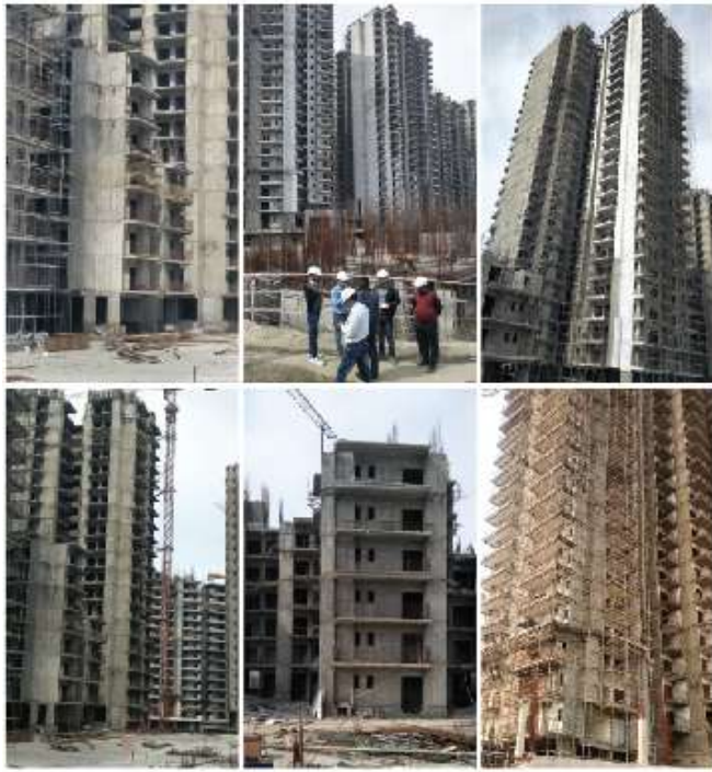
सोनीपत प्लॉट्स की साइट फोटो